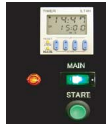
デジタルカウントダウンタイマー 残り時間が一目でわかります。