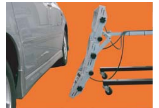
スプリングバランサー内蔵 ルーフからステップ乾燥まで ラクラク上下移動